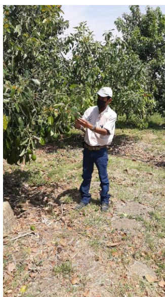
Figura 3. Acción de muestreo de barrenador de hueso en el Municipio de Atlixco.